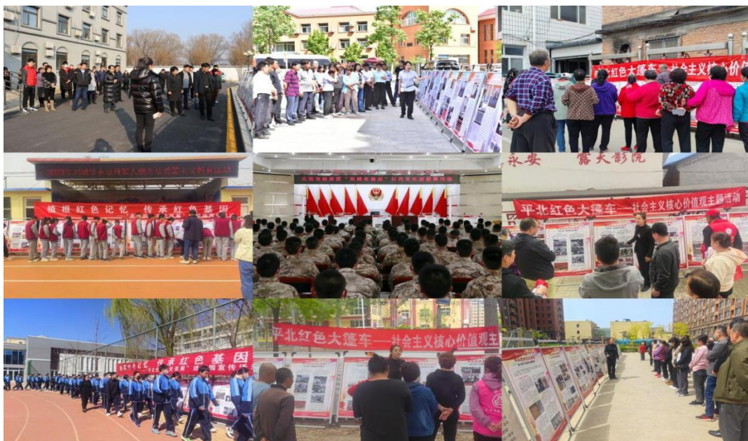
(图片为数字博物馆参观人数)