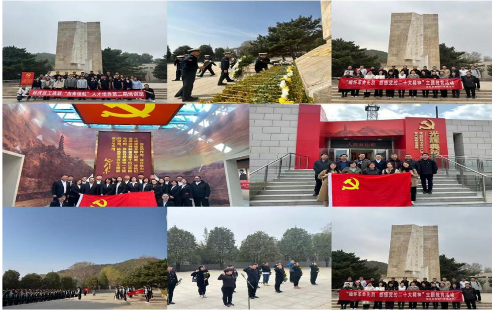
(图片为社会各领域来园参观)